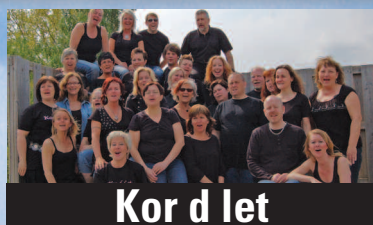
Kor d let